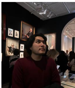
En admiration au musée Carnavalet

Témoignage d'un jeune réfugié arrivé en France il y a quelques mois et pour qui la langue française n'a plus de secret.